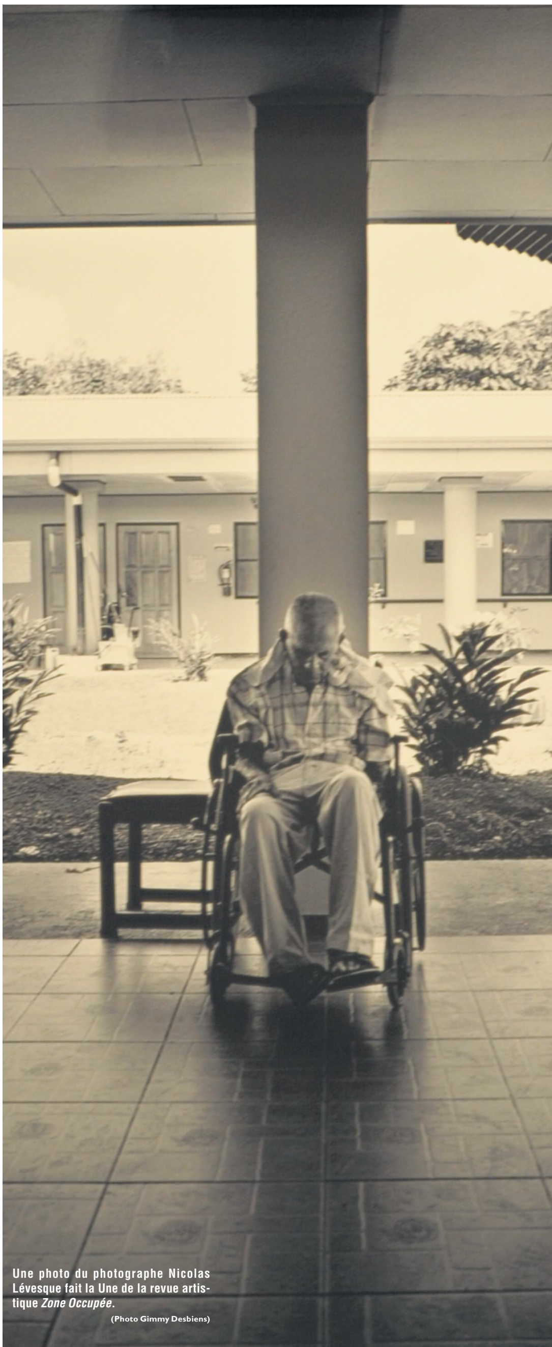
Une photo du photographe Nicolas Lévesque fait la Une de la revue artistique Zone Occupée .